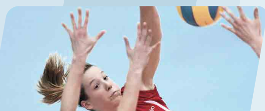
SPORT- UND MULTIFUNKTIONSHALLEN