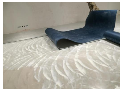
Einlegen der Matte in den Kleber

Der Dispersionskleber Uzin KE 2000 S wird mit einer Zahnpachtel A2 auf die Spachtelmasse aufgezogen . Der Kleber muss für 10 – 15 Minuten ruhen , bevor die Elastikschicht mit der Glasfaserschicht nach oben in den Kleber gelegt und auf die Länge zugeschnitten wird.