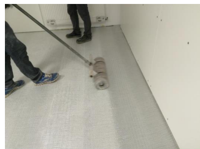
Abwalzen quer zur Matte

Nach einer Wartezeit von 10 Minuten wird mit einer mindestens 70 kg schweren Walze die Elastikschicht im Kreuzgang überarbeitet. Hierbei ist darauf zu achten, dass erst quer zur Bahn gerollt wird, um eventuell vorhandene Luft nach aussen zu drücken, dann wird die Bahn der Länge nach abgerollt und abschliessend nochmals quer .