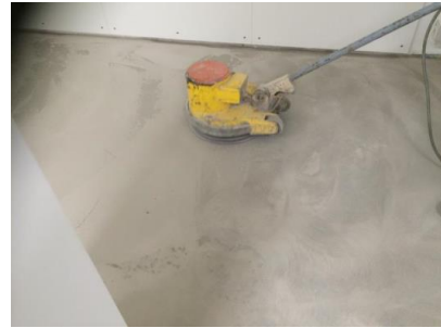
Schleifen der Fläche

Nachdem die Spachtelmasse ausgehärtet ist (je nach klimatischen Bedingungen / eingesetztem Spachtel / Spachtelmenge – ca. 24 Stunden), wird Fläche mit Tellerschleifmaschinen und Schleifmitteln der Körnung 16, 24 oder 36 geschliffen und im Anschluss sorgfältig abgesaugt.